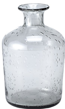
NEW CX 1711 ロゼガラスベースS ¥1,900 2280 (税抜)/1コ φ11.5×H18cm