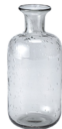
NEW CX 1713 ロゼガラスボトル ¥1,950 2340 (税抜)/1コ φ10×H21cm