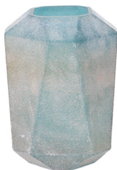
CS 675424 Dough Blue geometric glass vase ¥9,500 11400 (税抜)/1コ L16×W16×H21.5cm

メタリックブルーの多面体が集まるで宝石の原石を 彷彿とさせるガラスベース。 飾る向き、置き方によって様々な表情を見せてくれます。