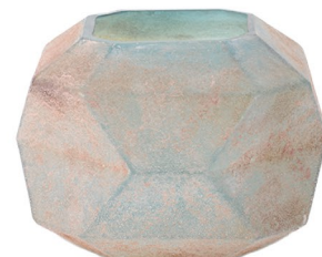
CS 675423 Dough Blue geometric glass vase ¥9,500 11400 (税抜)/1コ L23×W23×H16.5cm