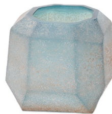
CS 675422 Dough Blue geometric glass vase ¥4,200 5040 (税抜)/1コ L14.5×W14.5×H13cm