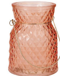
NEW GG 6019 セレーナハングブーケポット ¥800 960 (税抜)/1コ 口径 φ8.5、φ10×H13.5cm 6-ピーチ 23-グリーン