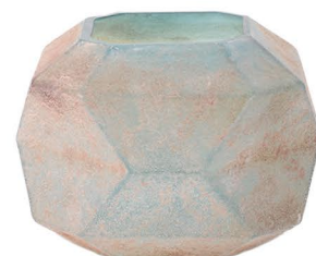
CS 675423 Dough Blue geometric glass vase ¥9,500 11400 (税抜) / 1コ L23×W23×H16.5cm