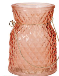
NEW GG 6019 セレーナハンGBPOTT ¥800 960 (税抜) / 1コ 口径φ8.5、φ10×H13.5cm 6・ピーチ 23・グリーン