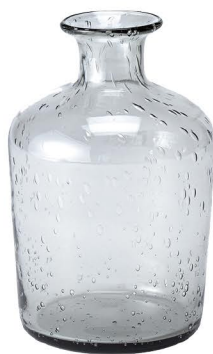
NEW CX 1711 ロゼガラスベースS ¥1,900 2280 (税抜) / 1コ φ11.5×H18cm