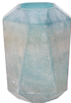
CS 675424 Dough Blue geometric glass vase ¥9,500 11400 (税抜) / 1コ L16×W16×H21.5cm