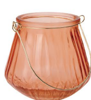
NEW GG 6018 セレーナハンGBPOTT ¥550 660 (税抜) / 1コ 口径φ8、φ10×H10cm 6・ピーチ 23・グリーン