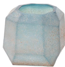
CS 675422 Dough Blue geometric glass vase ¥4,200 5040 (税抜) / 1コ L14.5×W14.5×H13cm