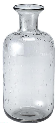
NEW CX 1713 ロゼガラスボトル ¥1,950 2340 (税抜) / 1コ φ10×H21cm