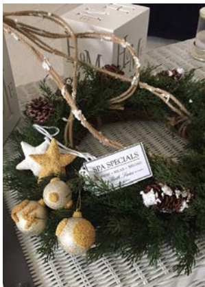
講習作品 ※作品サイズ Φ35cm

色々なものに貼り付けることができ、形も自由自在に作れる粘着力のある大好評ボールクレイ。今回はオーナメントの星やボールに貼り付けオリジナルのオーナメントを作ります。また、Rose Boxオリジナルのリースを使って大人可愛いクリスマスフライングリースを制作します。